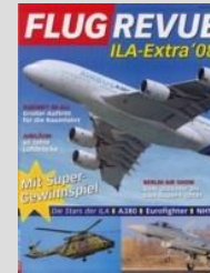
ILA in Berlin