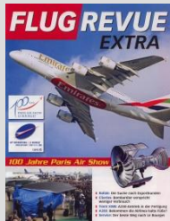
PARIS AIR SHOW in Paris

Informationen zu den großen internationalen Luftfahrtmessen. Erscheint anlässlich der jeweilige Messe als Heft in der FLUG REVUE. Zusätzlich werden Bonusauflagen an die Besucher der Messen verteilt.