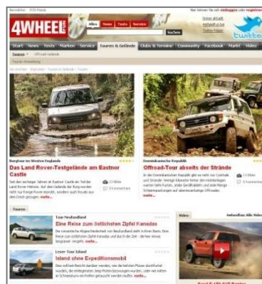
4wheelfun.de – Touren & Gelände Übersicht