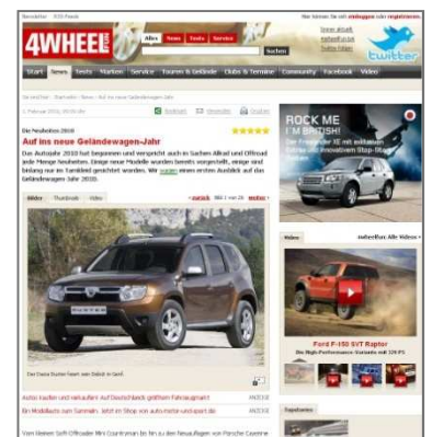
4wheelfun.de – Supertest Artikel