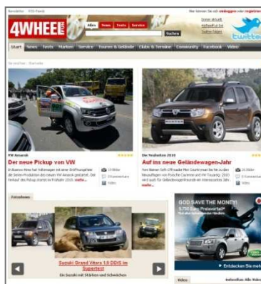
4wheelfun.de – Startseite